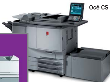
Océ CS 620