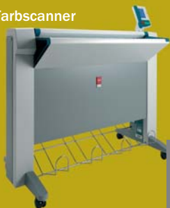
Océ TC4 Farbscanner