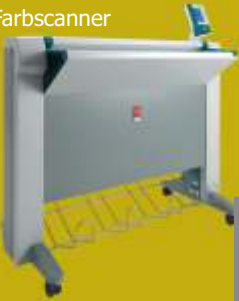
Océ TC4 Farbscanner